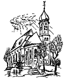
St. Johann Baptist