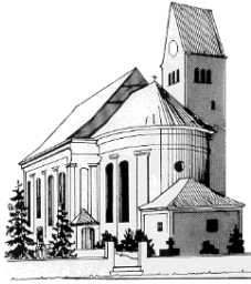
St. Peter u. Paul