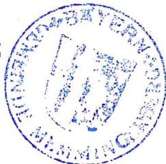
Lichtensteiger Erster Bürgermeister