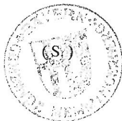
Lichtensteiger 1. Bürgermeister